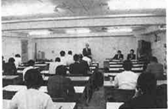
関係事業者約30人が参加した